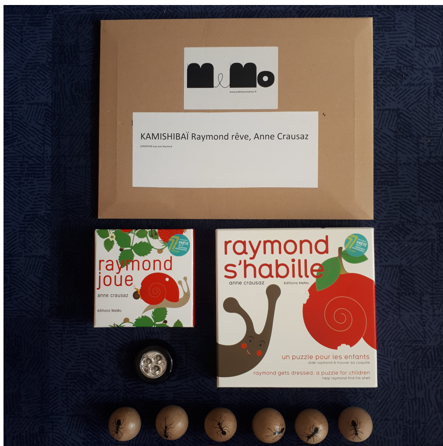
1 kamishibai Raymond rêve, 1 lampe à led, 6 balles "fourmis", mémoire Raymond joue, puzzle Raymond s'habille