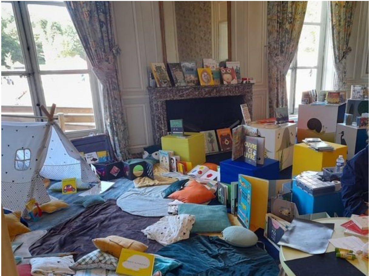
Installation au Château de Bénouville (Calvados)