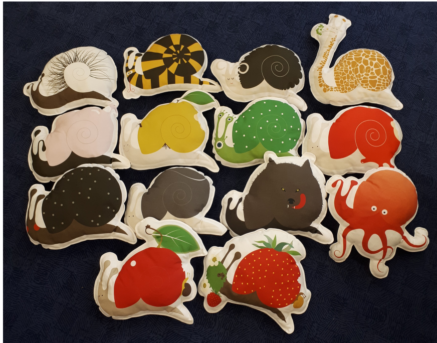
14 coussins en forme d'escargot