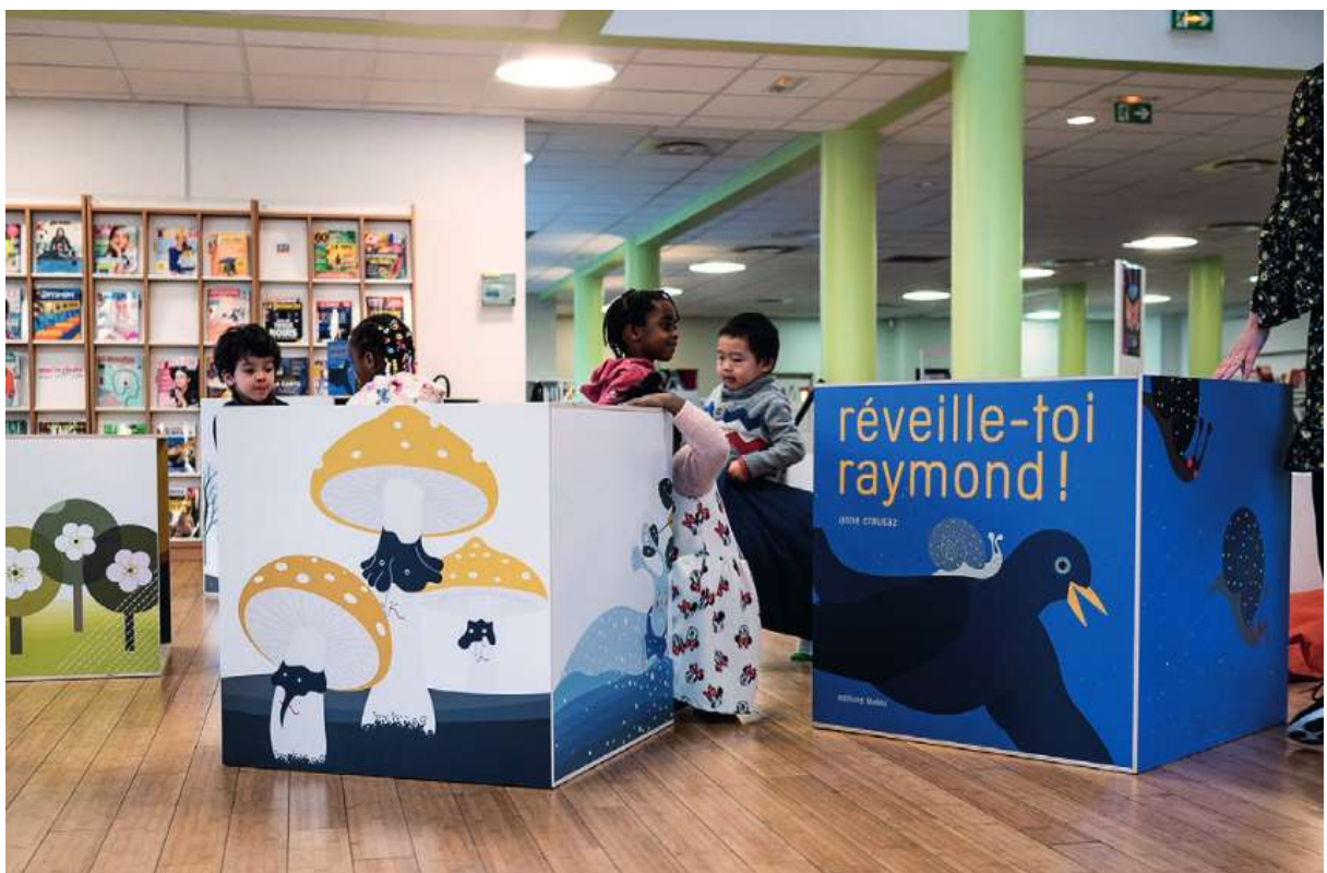
Installation en médiathèque